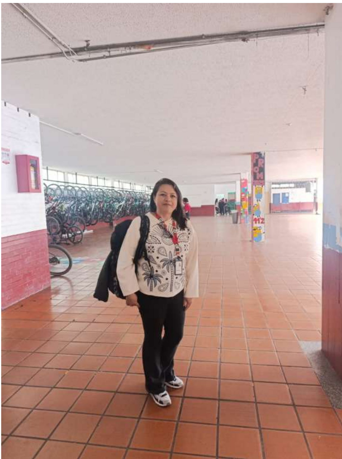
Visita manuela beltran extemporánea matriculas miércoles 4 de marzo I,E Manuela Beltrán